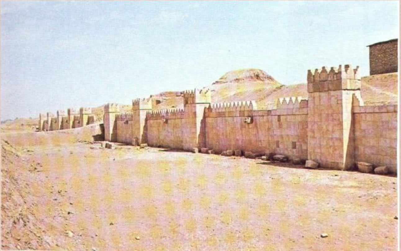
Mura fortificate di Ninive