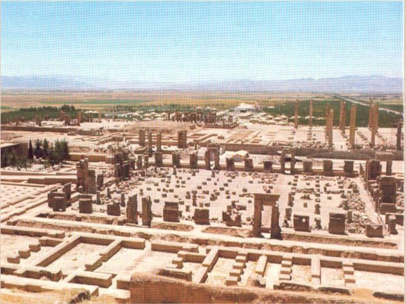
Persia: veduta aerea del centro di Persepoli; in primo piano il palazzo del re Dario

4. L'interno della città ti sembra organizzato in modo semplice o complesso?